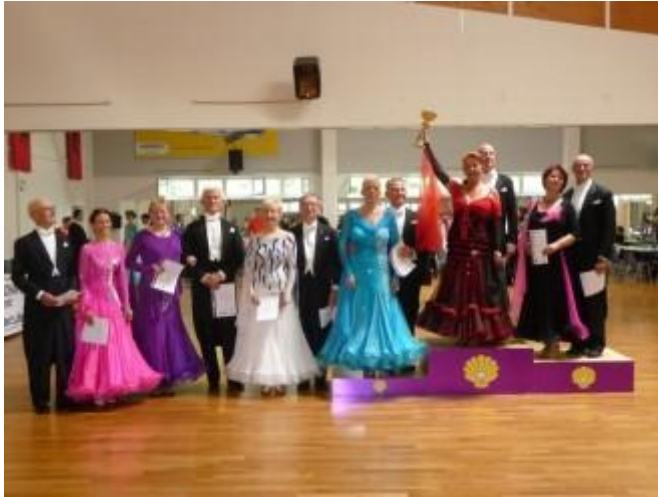
Verleihung des DTSA 16.07.2013 Siegerehrung Senioren IV S