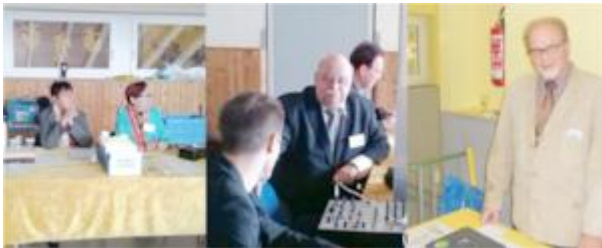
Helfer in der Organisation

Der TSC Grün-Gelb Erftstadt konnte in diesem Jahr auf viele helfende Hände aus einigen Gruppen zurückgreifen. Der Vorstand bedankt sich ganz herzlich bei allen Helfern. Dies gilt für die Kuchenbäckerinnen und - das sei betont- auch die Kuchenbäcker.