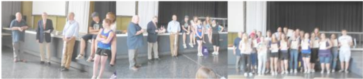
Verleihung des DTSA 16.07.2013