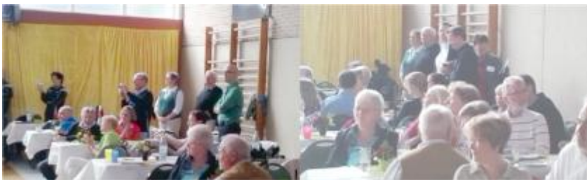
Die Fans

Eine wichtiger Aspekt darf nicht vergessen werden: die Fans. Ihr Applaus war Motivation für die Paare am Start. Unsere Paare bedankten sich bei der Fangemeinde mit guten Leistungen. Ergebnisse und weitere Fotos finden Sie auf der Internetseite " Tanzen an Erft und Rur ". UM/PM