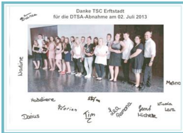
Dank der Schüler an den Club

und frisch motiviert für weitere Turniere fest. Der TSC gratuliert zu dem Erfolg. PM